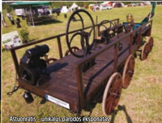
Aštuonratis – unikalus parodos eksponatas