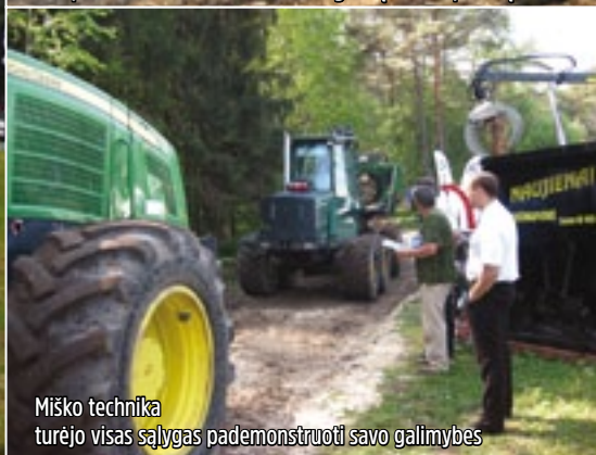
Miško technika turėjo visas sąlygas pademonstruoti savo galimybes