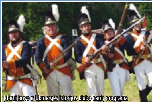
Įdomi buvo ir Ukmergės istorijos klubo narių programa