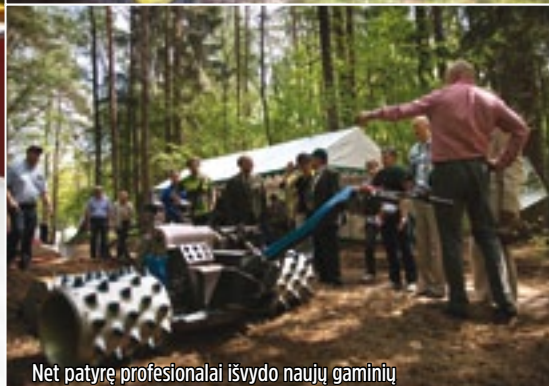
Net patyrę profesionalai išvydo naujų gaminių